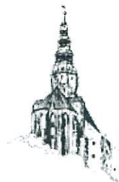
Kościół pw. Św. Stanisława i Św. Waclawa Katedra Diecezji Świdnickiej